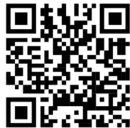
Neues Bau- und Zonenreglement