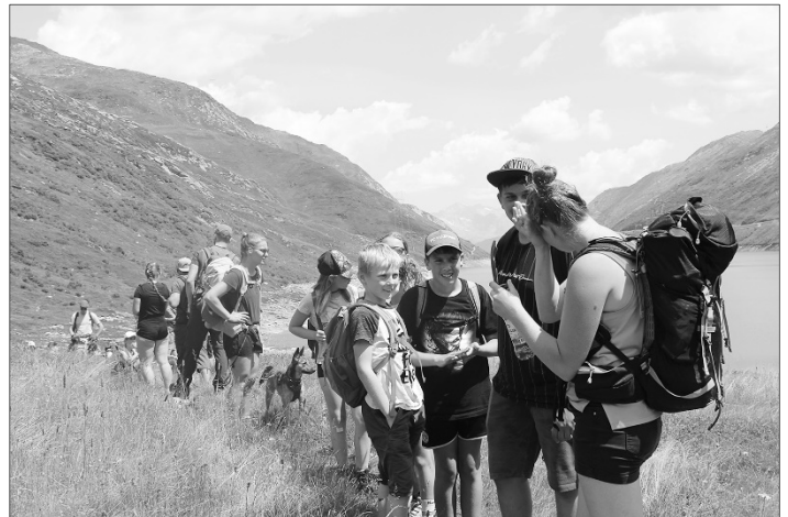
Kurzer Zwischenstopp auf der Wanderung um den St. Maria Stausee.

Da Detektive sich fit halten müssen, wanderten wir am Montag um den Stausee und gingen jeweils am Abend joggen oder Velo fahren. Auf einer Schnitzeljagd in Curaglia haben die Hergiswiler Detektive unter Beweis gestellt, dass sie auch das Kartenlesen und gleichzeitige Rätseln sehr gut beherrschen. Zudem mussten sie beim Überqueren der Hängebrücke ihren Mut unter Beweis stellen und zeigten, dass sie auch in Ausnahmesituationen einen kühlen Kopf bewahren können. Naja und dann war da der Mittwoch. Die Agenten hatten eine anstrengende Zeit und verschliefen die Tagwache. Agent Unbekannt hat den Kindern aber glücklicherweise ein Rätsel für den Morgen bereit gemacht. Zuerst mussten die Detektive das Schloss für die Küche knacken und anschliessend das Frühstück bereitstellen und die Agenten von ihrem Bett trennen. Da die Agenten vor lauter Müdigkeit auch nicht mehr dazu kamen etwas für den Tag zu planen haben dies die Detektive direkt selber in die Hand genommen und in Gruppen verschiedene Rätsel und Adventure Rooms geplant und später dann auch gelöst.