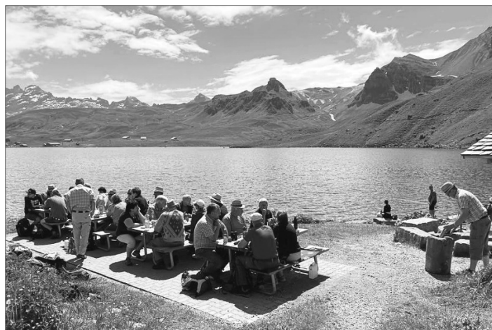
Gemütliches Beisammensein am Melchsee.

Auf dem Heimweg ging es ins Restaurant Lamm nach Menzau. Dort gab es ein wunderbares Nachtessen. In Hergiswil angekommen, ging es für den Tagesausklang ins Restaurant Kreuz. Es war ein sehr gemütlicher Tag. Der Ausflug wurde tadellos vom zweiten Tenor organisiert. Ihm gebührt ein grosser Dank.