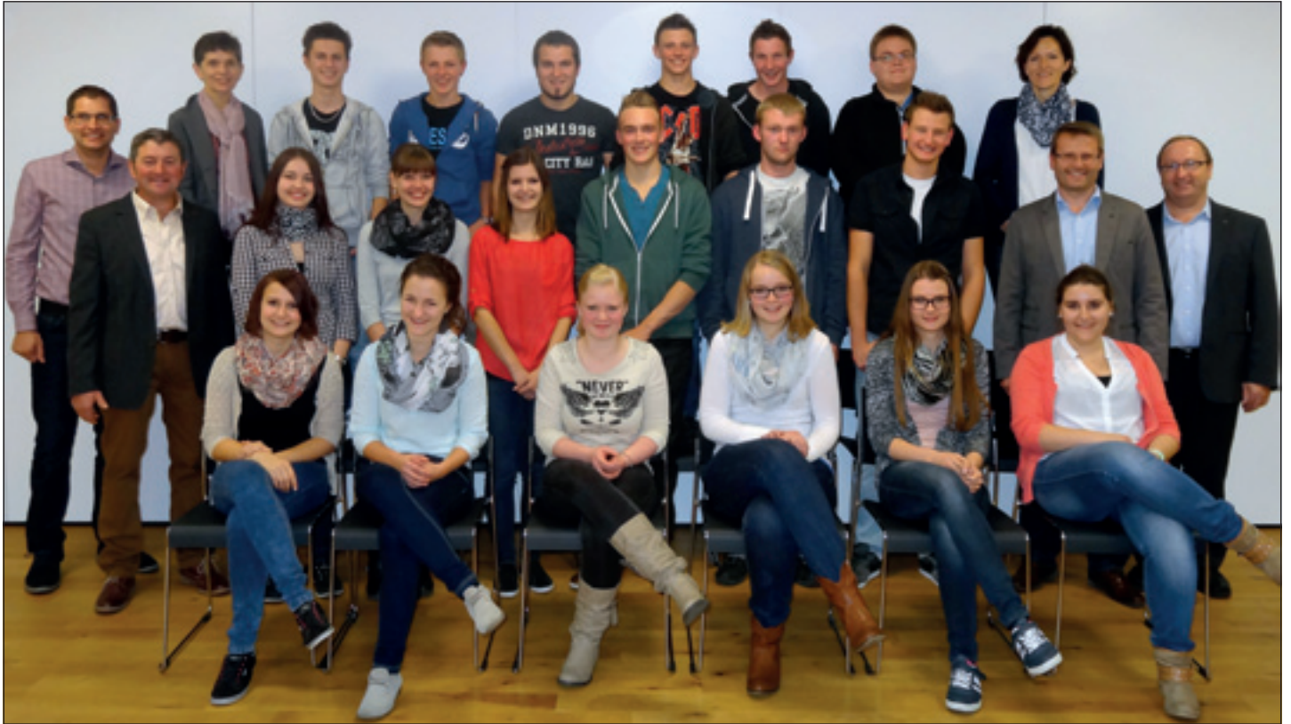
Die Hergiswiler Jungbürger sowie der Hergiswiler Gemeinderat und -schreiber.