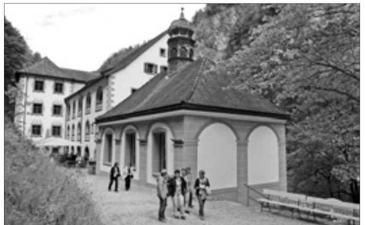
Hergiswiler Frauen besuchten das Alte Bad Pfäfers und die Tamina-schlucht.

Am Donnerstag, 18. September, machte sich eine muntere Schar Frauen auf den Weg nach Bad Ragaz. Ein Kaffeehalt im Hotel Engel in Wädenswil unterbrach die Fahrt von über zwei Stunden. In Bad Ragaz angekommen, tauschten wir den Car mit einem Postauto, welches uns durch die Tamina-schlucht ins Alte Bad Pfäfers brachte. Nach einem feinen Essen im renovierten Speisesaal der damals gehobenen Gesellschaft, erzählte uns der Geschäftsführer einiges Wissenswertes über das Bad Pfäfers.