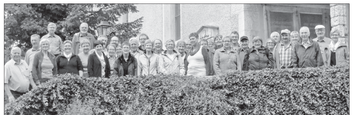
Reiselustige Gesellschaft bei der Pfarrkirche St. Niklaus in der Nähe der Verenaschlucht.

Auf einer engen und steilen Strasse fuhren wir dann auf den Weissenstein, wo uns im Restaurant Sennhaus das Mittagessen serviert wurde. Frisch gestärkt fuhren wir wieder hinunter vor den Eingang der idyllischen Verenaschlucht. Ein kurzer Spaziergang entlang des Baches führte