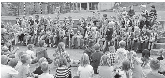
Die Kindergärtler mit ihren Gottis und Göttis.

Zu dem von den Katechetinnen eindrücklich auf das Jahresthema «vernetzt» hin gestalteten Wortgottesdienst trafen sich Schülerinnen und Schüler, Lehrerinnen und Lehrer sowie eine grosse Zahl Eltern am Montag, 18. August 2014, in der Pfarrkirche St. Johann. Für die an der Schule Hergiswil tätigen Lehrpersonen waren bereits in der Woche vorher schul- und stufeninterne Weiterbildungen und Planungs- und Vorbereitungssitzungen angesagt.